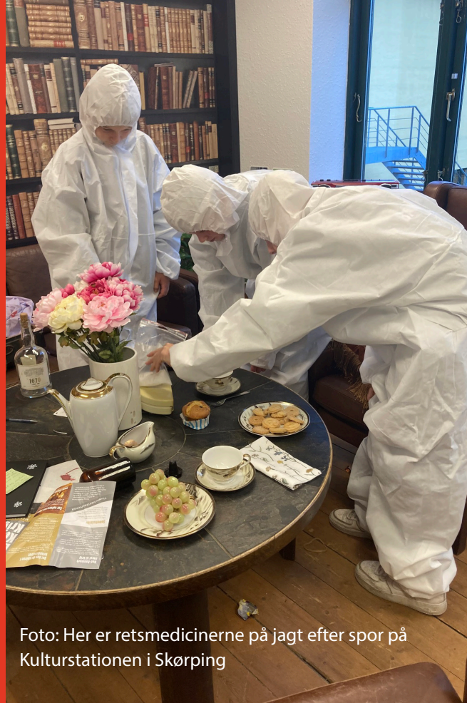
Foto: Her er retsmedicinerne på jagt efter spor på Kulturstationen i Skørping