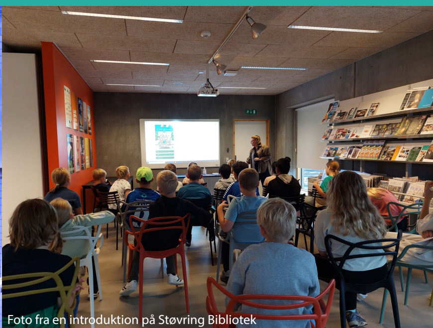
Foto fra en introduktion på Støvring Bibliotek